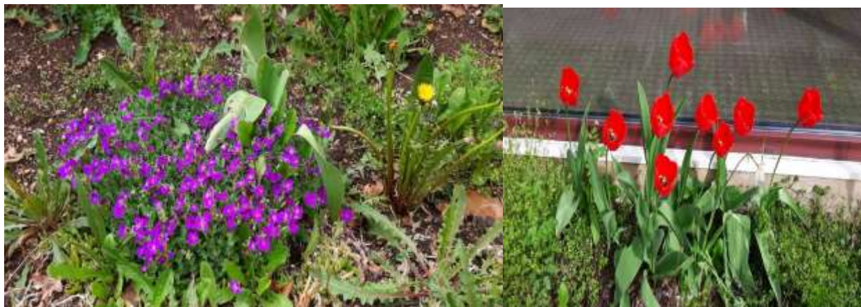
Fotografija svibanjskog vrta: M.K. svibanj 2021.