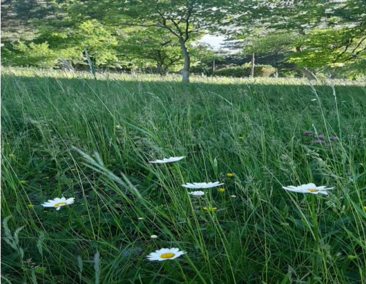
livada u travnju

Cijeli ovaj mjesec posvetit ćemo u knjižnici dvama datumima: