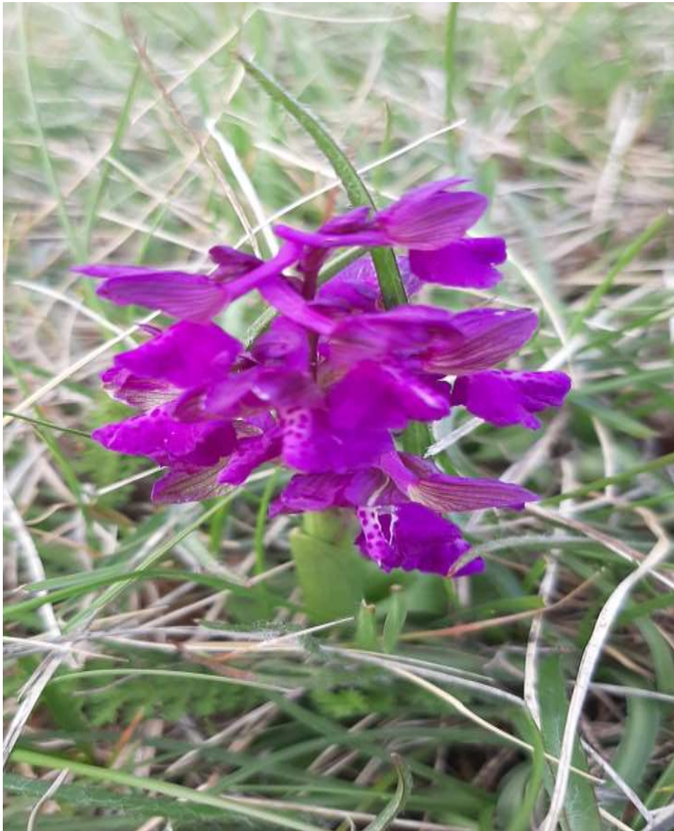
ljepota travanjskog vrta (M.K.)

ili uživaj u ljepoti travanjskoga cvijeta s ove prekrasne fotografije