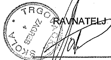
Danko Grgurić, prof.

KLASA: 602-03/19-17/001 URBROJ: 251-107-01-19-0004 Zagreb, 8. ožujka 2019. godine